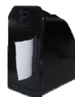
Conjunto impresora intercambiable